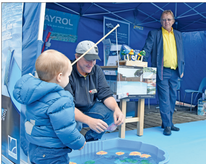
Seit knapp einem Jahr ist das Familienunternehmen KiWi Pool Service in Küssnacht und zum ersten Mal am Mäart. Sie boten eine Kinderattraktion aus ihrem Metier: Ein Pool, aus dem Plastikfische gefischt wurden.