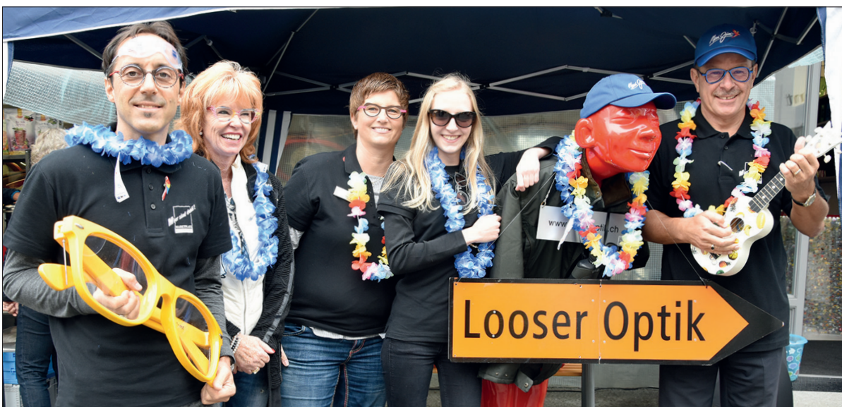
Looser-Optik schwang heuer hohe Töne, Hüften und Sonnenbrillen. Sie wählten das Motto Hawaii und waren entsprechend gekleidet. Zudem konnten Mäart-Gänger ihre Brillen zum Putzen vorbeibringen.